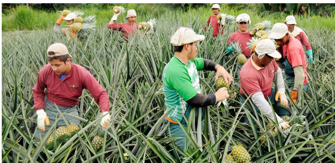
La variedad Golden Sweet es de sabor dulce, tamaño y aroma. El Universo.

De hecho, señala la cartera de Estado, gracias al buen desempeño de los envíos de la fruta ha permitido también que se posicione como el octavo proveedor a escala mundial . La piña ecuatoriana exportada, además, cuenta con certificaciones como la Global GAP, Rainforest Alliance y BASC.